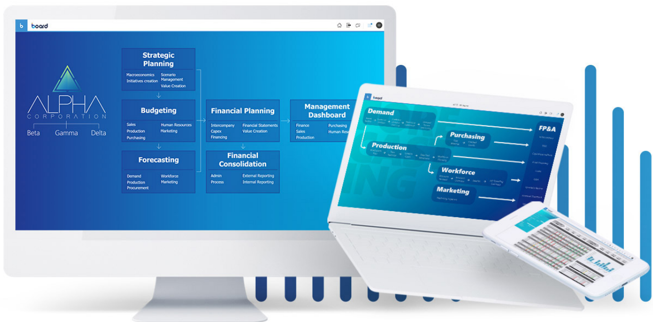
Abb. 1: Integrierte Business Planung (IBP)

Business Intelligence, Predictive Analytics und Performance Management in einem.