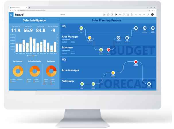
Abb. 3: Vertriebsplanung